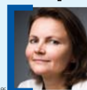
PAR VALÉRIE SEGOND

Le rapport Medef-Afef sur la façon dont les groupes du SBF 120 ont appliqué leurs recommandations d'octobre 2008 sur la rémunération de leurs dirigeants ne fera pas taire les Saint-Just. Partant du principe que les règles de transparence suffisent à décourager les comportements cupides, ce document ne porte que sur la qualité de l'information des entreprises cotées publiée dans leur rapport annuel. Mais il ne dit rien sur le montant, ni même sur l'évolution des émoluments des patrons français en 2008. Il ne permet donc pas de porter un jugement sur une éventuelle modération des appétits patronaux. Tout juste révèle-t-il que le nombre de sociétés ayant attribué des stock-options à leurs mandataires sociaux a baissé en 2008. Et que 64 % des mandataires sociaux ne bénéficient pas, ou plus, de contrat de travail. Cela suffit-il à conclure à une moralisation des pratiques ? À l'évidence, c'est un peu tôt. Si une entreprise sur deux a prévu de verser des indemnités de départ à son dirigeant, les trois quarts