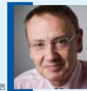
PAR PIERRE-ANGEL GAY

On sait l'Europe malade de sa démographie. Mais on n'a sans doute pas assez mesuré combien la démographie compromet l'idée même d'Europe. Depuis quarante ans, le taux de natalité s'est effondré sur le Vieux Continent. Ce phénomène, couplé à une augmentation générale de la durée de la vie, entraîne un vieillissement accéléré de la population. Le cas allemand est à cet égard exemplaire. L'étude que vient de publier l'institut Destatis confirme ce que l'on savait déjà, mais en pire ! Avec un taux de fécondité oscillant depuis trente ans entre 1,3 et 1,4 enfant par femme en moyenne – il en faudrait 2,1 pour remplacer les générations –, la population d'outre-Rhin est entrée dans une phase de décroissance accélérée. L'an dernier, on y dénombrait plus de 82 millions d'habitants. Destatis estime qu'ils ne seront plus que 65 à 70 millions en 2060, dont un tiers de plus de 65 ans et 15 % de plus de 80 ans ! Certes, l'Allemagne n'est pas seule dans ce cas. Mais le contraste est chaque année plus saisissant avec les pays européens à la démographie plus dynamique, France en tête, où le taux de natalité dépassait l'an dernier les 2,07 enfants par femme. Ce grand écart va bouleverser la hiérarchie des pays de l'Union européenne.